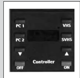
EVoline® Intelligence Module

Wählen Sie: Spezifikation Kabelanschlusslänge