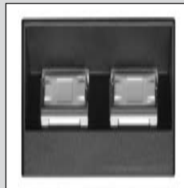
EVoline® Daten-Netzwerk Module

Wählen Sie: Spezifikation Kabelanschlusslänge