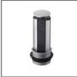
EVoline® Port Individuell

Wählen Sie: Ausführung Kabelanschlusslänge Lochsäge siehe Seite 121