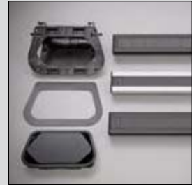
EVoline® SubDesk Individuell

Wählen Sie: Ausführung Kabelanschlusslänge