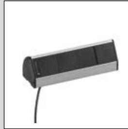
EVoline® Dock Individuell

Wählen Sie: Ausführung Kabelanschlusslänge Befestigung/ Zubehör