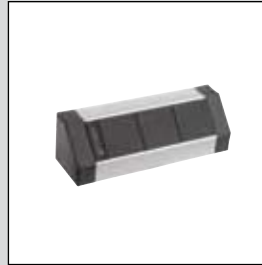
EVoline® V-Dock Individuell

Wählen Sie: Ausführung Kabelanschlusslänge