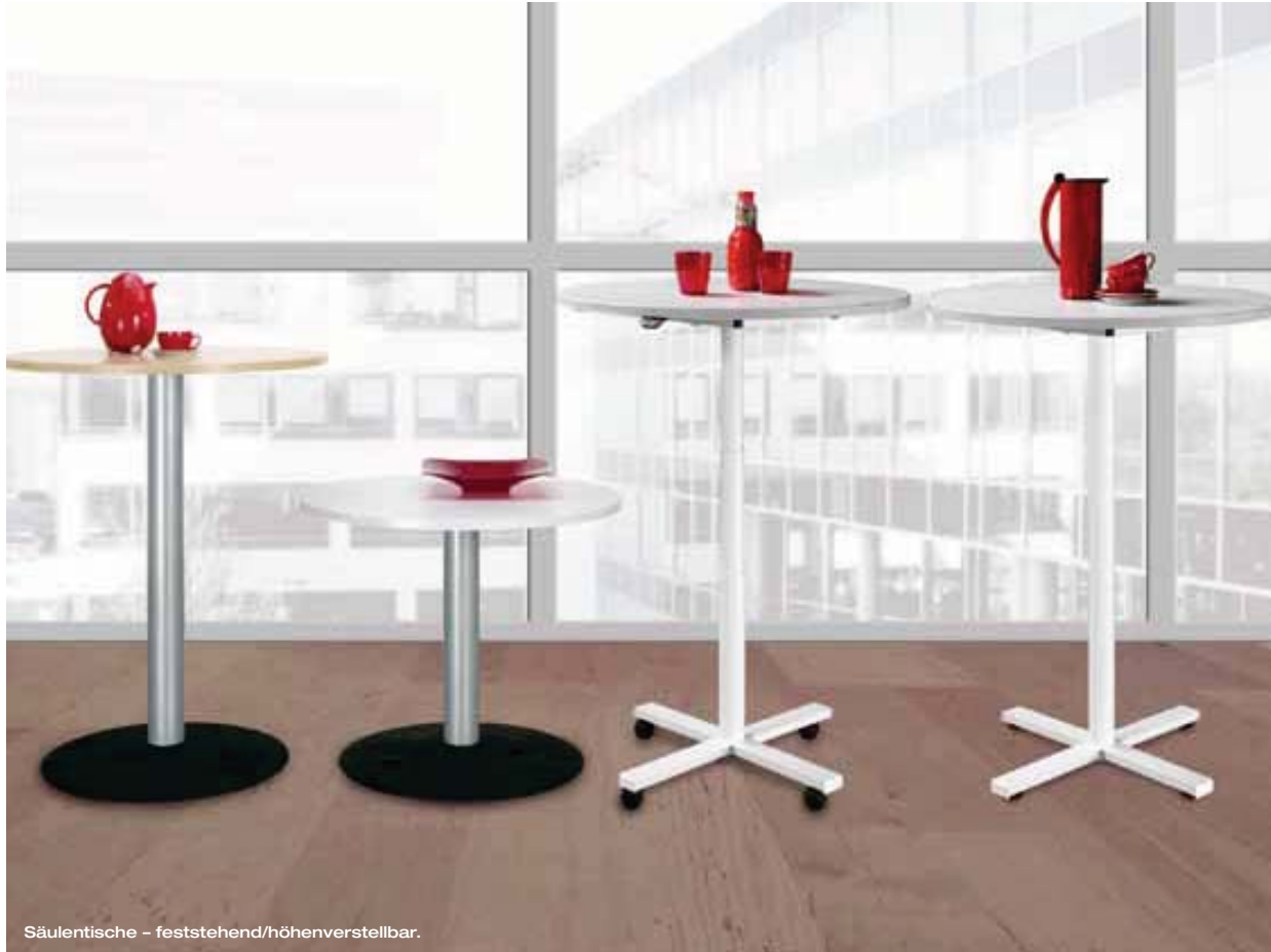
Säulentische - feststehend/höhenverstellbar.

Säulen- und Hubsäulentische bieten eine flexible Lösung in Konferenzen und Besprechungen. Mobil, vielseitig und mit verschiedenen Plattenformen verfügbar, gestalten sie auch als Ansatzische jeden Arbeitsplatz ergonomisch.