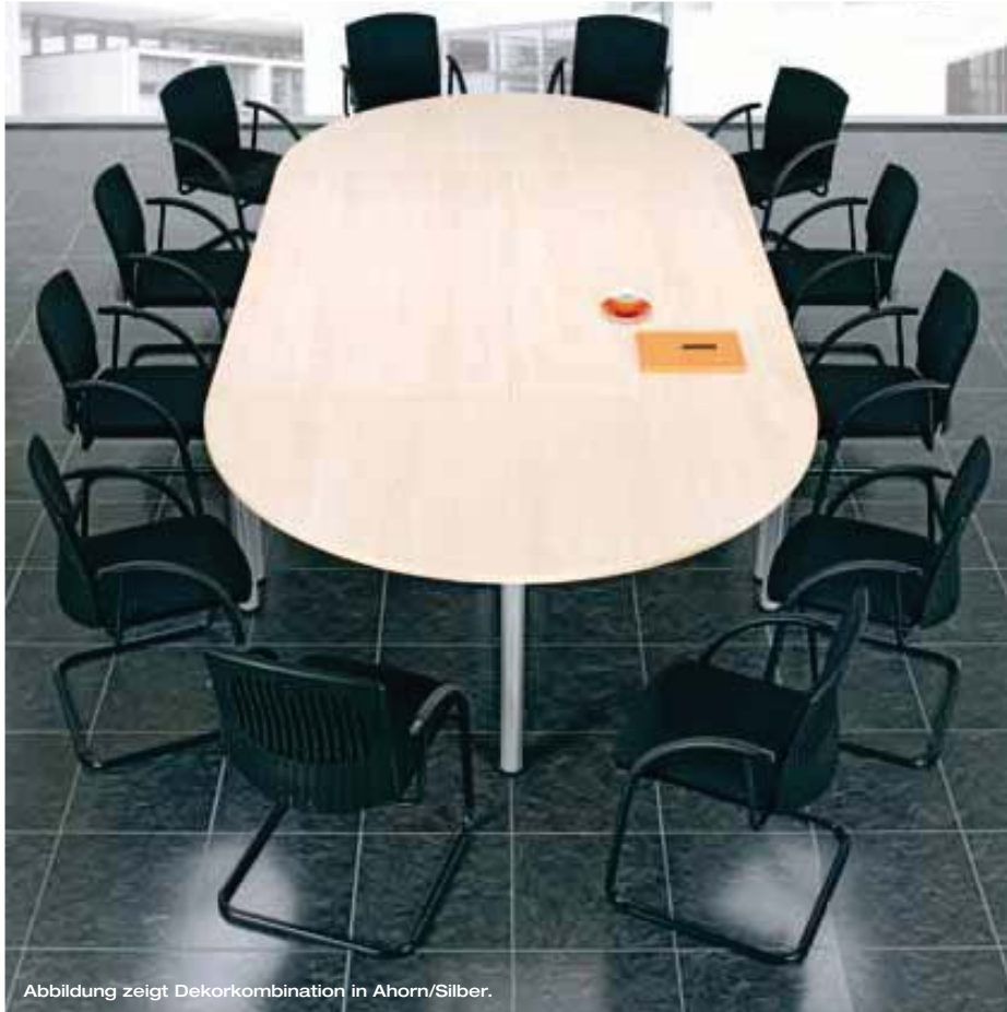
Abbildung zeigt Dekorkombination in Ahorn/Silber.

Flexible Konferenztische auf Rundrohrfüßen ermöglichen in jedem Umfeld eine gute Kommunikation. Dies gilt für repräsentative Konferenzen ebenso wie für spontane Meetings im kleinen Kreis. Schön, wenn neben Raum für neue Konzepte und Ideen auch noch genügend Platz für unmittelbare Ausführungen, Pläne, Skizzen und Materialproben bleibt.