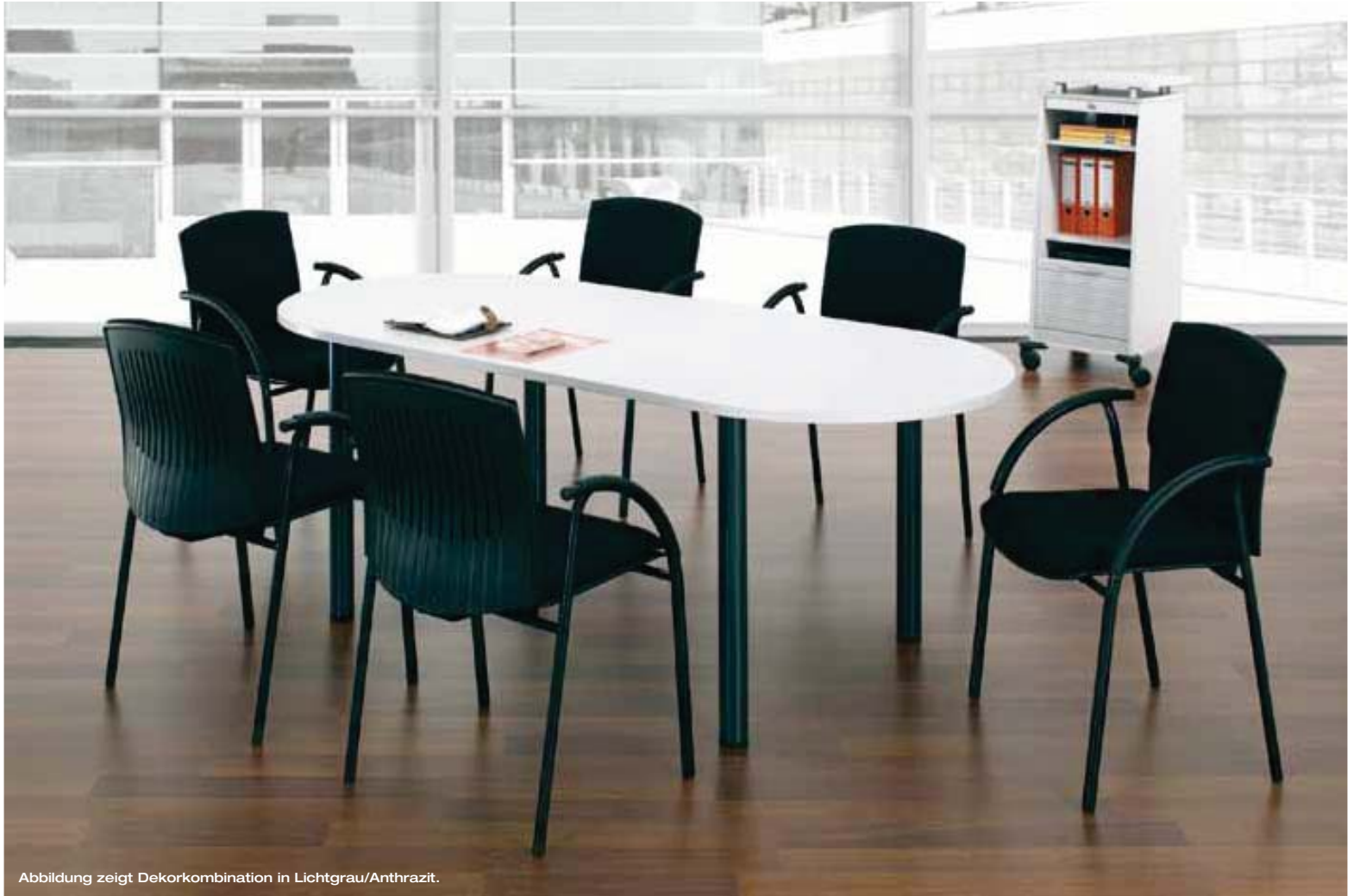
Abbildung zeigt Dekorkombination in Lichtgrau/Anthrazit.