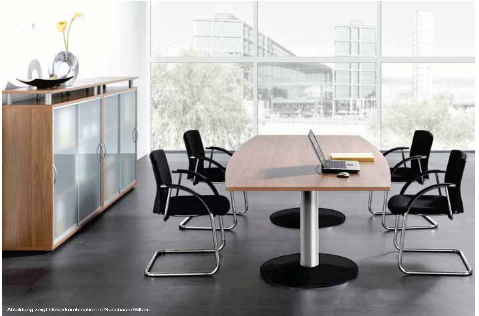
Abbildung zeigt Dekorkombination in Nussbaum/Silber.