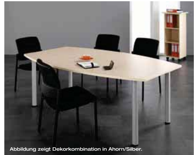
Abbildung zeigt Dekorkombination in Ahorn/Silber.

Flexible Konferenztische auf Rundrohrfüßen ermöglichen in jedem Umfeld eine gute Kommunikation. Dies gilt für repräsentative Konferenzen ebenso wie für spontane Meetings im kleinen Kreis. Schön, wenn neben Raum für neue Konzepte und Ideen auch noch genügend Platz für unmittelbare Ausführungen, Pläne, Skizzen und Materialproben bleibt.