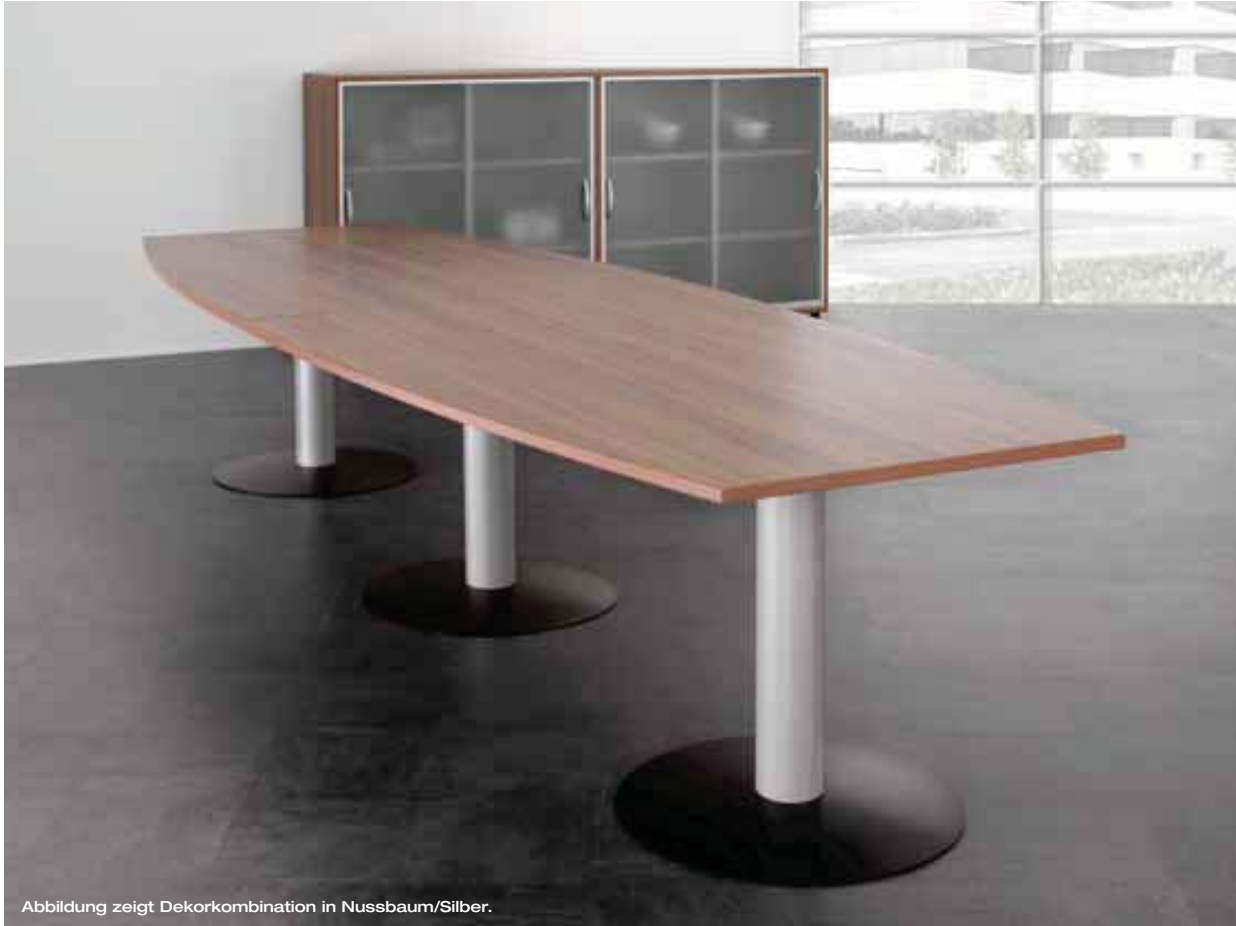
Abbildung zeigt Dekorkombination in Nussbaum/Silber.

Dieser Konferenztisch auf anmutenden Säulenfüßen ist in seiner Länge beliebig erweiterbar. Damit wird er den räumlichen Anforderungen ebenso gerecht wie der Anzahl der Teilnehmer.