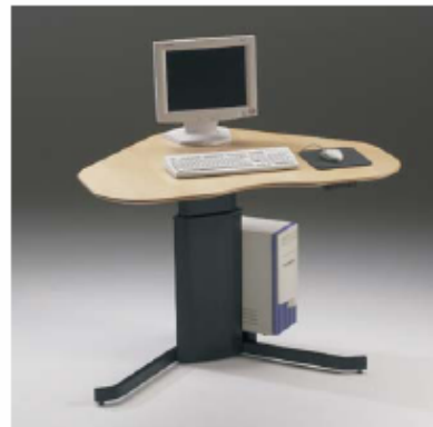
ConSet / Ronde Hoep

Elektromotorverstelling, 68 - 120 cm Vanaf € 540,-