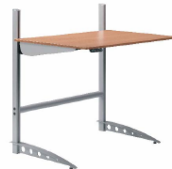
Proffice / LT

Elektromotorverstelling, 57 - 132 cm Vanaf € 850,-