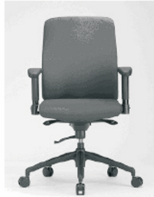
Interstuhl / Yos

Duitsland / Synchromechanisme €499 - €950