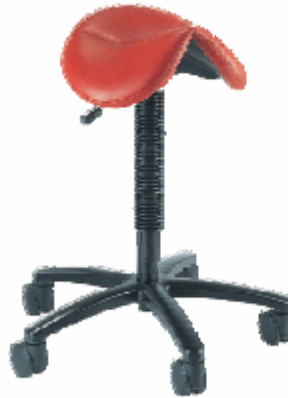
Score / Jumper