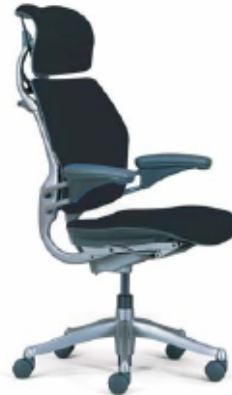
USA / Free Floating mechanism €940 - €1.500