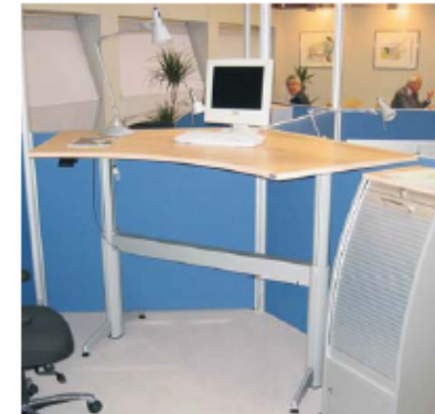
Fleischer / Argo-T

Elektrische of handverstelling, 68-120 cm Vanaf € 800,-