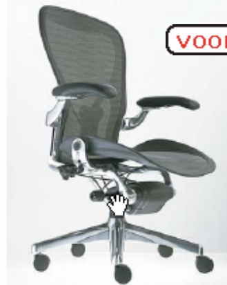
Herman Miller / Aeron