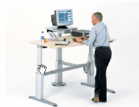
Alvar / Herman Miller

Elektrische verstelling, 60 - 125 cm Vanaf € 1.400,-