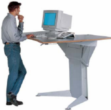
Amstel / HELOS

Handverstelling, 62 - 128 cm Vanaf € 2.100,-