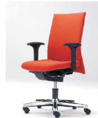
Duitsland / Synchromechanisme €390 - €793