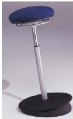
Comforto / Syst 1