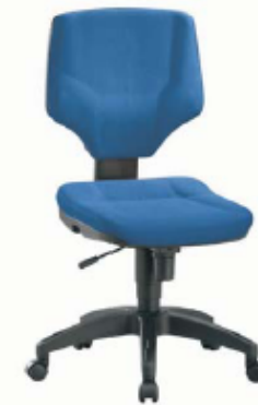
Prosedia / Start