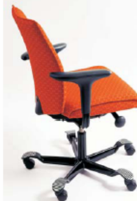
HAG H04 - H05

Noorwegen / Schommelmechanisme €593 - €1.393