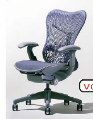
Herman Miller / Mirra