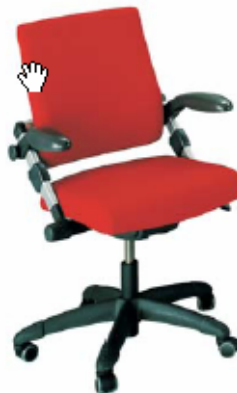
Noorwegen / Schommelmechanisme €225 - €650