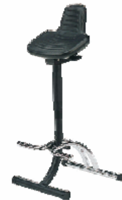
Score / Steady-S