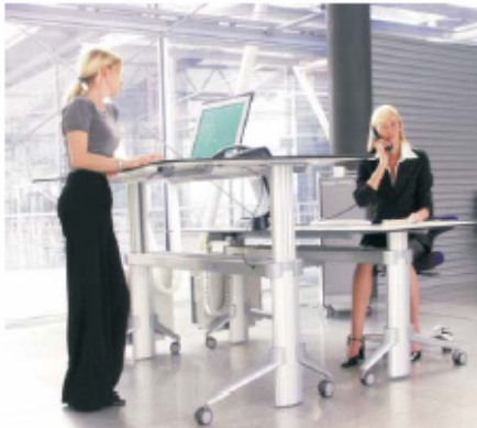
Go2Move / Leuwico

Handverstelling, 62 - 128 cm Vanaf € 1.200,-