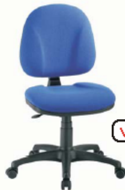
Prosedia / Base

Duitsland / Synchroonmechanisme Netto €331 - €560