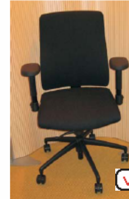
Interstuhl / Huisstoel 162Q

Duitsland / Synchromechanisme €499 - €950