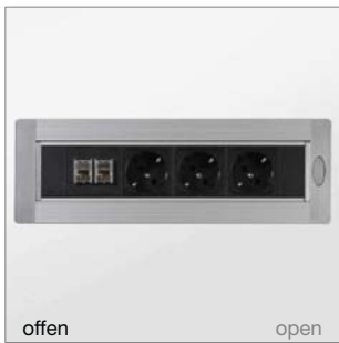
Turnbox drehbar, wahlweise links und rechts Turnbox rotatable optionally left and right