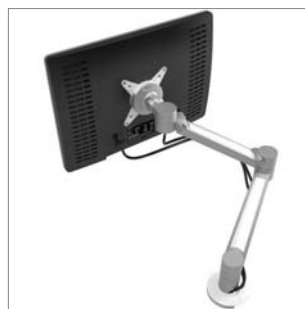
Monitorarm (MA2) komplett dynamisch verstellbar monitor arm completeley dynamic adjustable