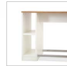
Ablagemodul optional 2 Fächer Storage module optionally 2 compartments