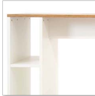
Korpusfarbe wählbar Melamin Dekor carcass color selectable melamine decor