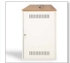
Technikmodul optional inkl. 2 Kabeldurchlässen Tür wahlweise in allen RAL Farben Technical modules optionally Incl. 2 cable outlets Door available in all RAL colors