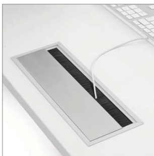
Kabelschacht cable duct