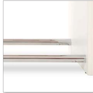
Fußablage hochglanzchrom footrest mirror finish