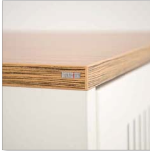
Tischplattenfarbe wählbar Melamin Dekor, Echtholz Furnier Table top color selectable melamine decor, veneer