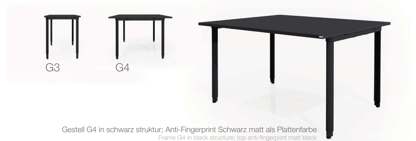
Gestell G4 in schwarz struktur; Anti-Fingerprint Schwarz matt als Plattenfarbe Frame G4 in black structure; top anti-fingerprint matt black

Height adjustable iSHAPES G4 crystal white structure; tops anti-finger- print matt black. Background iSHAPE conference desk G1 with top in free form in black structure; top anti-fingerprint matt white; turnbox. Mobile pedestal DARC-3 fronts crystal white structure; carcass crystal white. One worksta- tion: CPU holder, monitor arm by LEUWICO white. Workplace luminaires PARA.MI by Waldmann in black; Pendant light A65 and C95 by Glamox in white. Backapp chair with wheels in yellow and black. Götessons plants Bamboo and Sansiveria in dark gray pot, sitting balls „Office Ballz“, acous- tic elements „Sound off Ecosund wall“. Conference chairs „MONICO“, Steifensand. These products are available through LEUWICO.