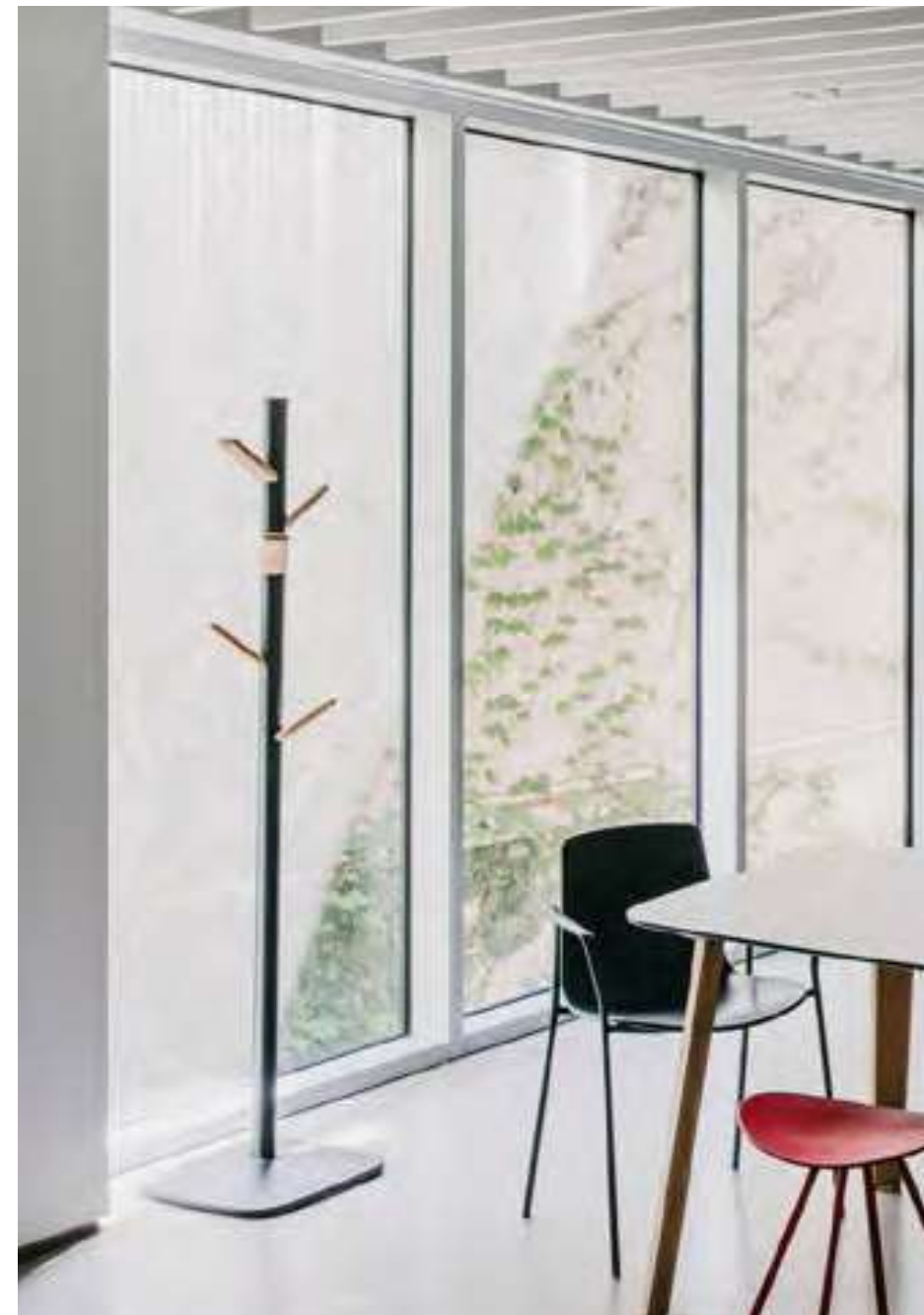
Caddy coat stand (ref. 9530), with natural wood hooks and structure in RAL 9016.

Su estilizado diseño de formas curvas está concebido para ejercer un impacto mínimo en las prendas colgadas.