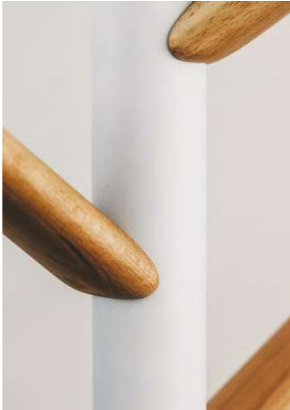
On the right: Caddy coat stand (ref. 9530), lacquered in Pantone 5753 C and hooks in natural wood.