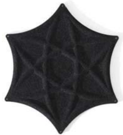
Line stängd Line closed