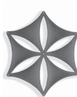
Blade öppen Blade open