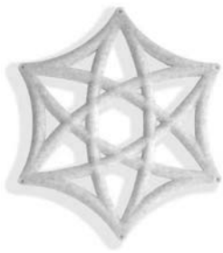
Line öppen Line open