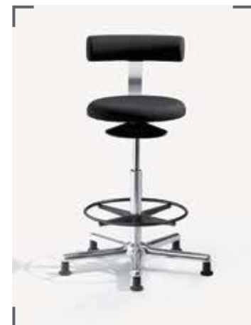
AOGO XL E