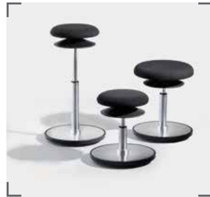
ERGO 1 und ERGO 2