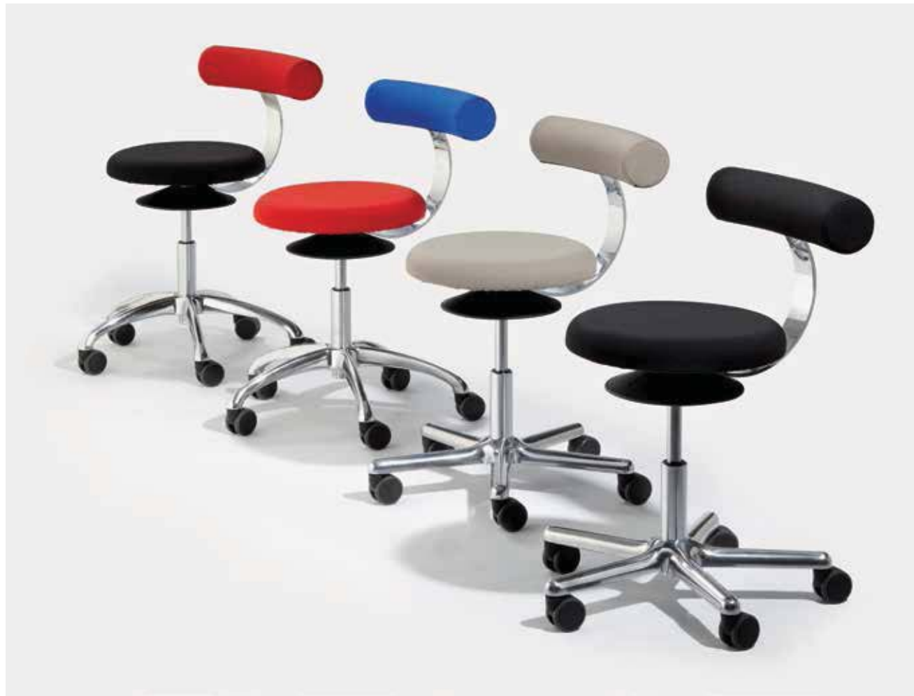
AOGO A und AOGO E