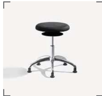
ERGO 3 A