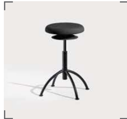
ERGO 3 V