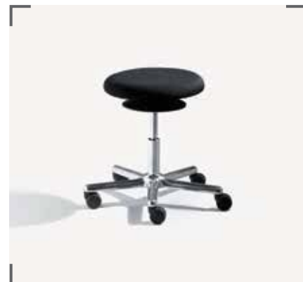
ERGO 3 E