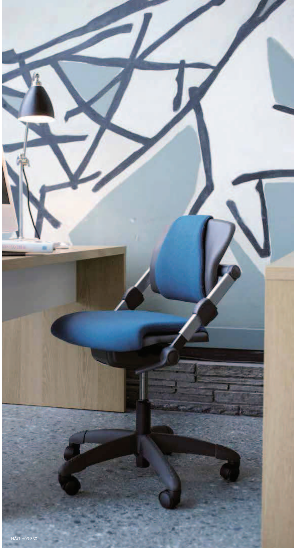
HÅG H03 330