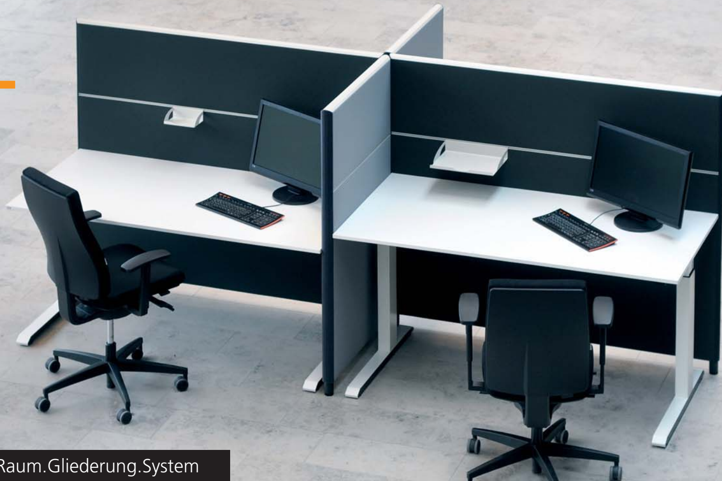
SILENCE LINE Raum.Gliederung.System